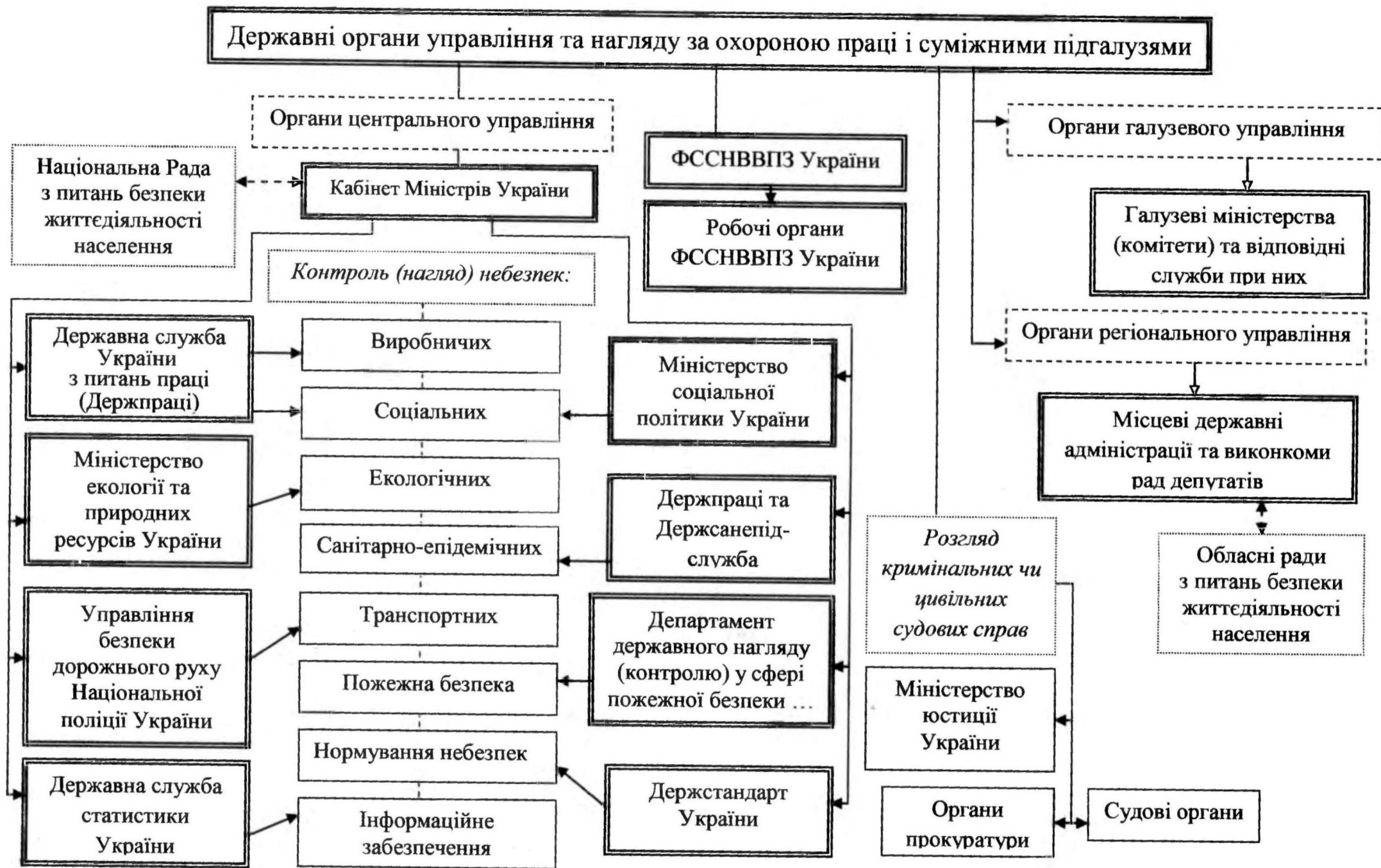
Рис. 3. Блок-схема системи державних органів управління та нагляду за охороною праці